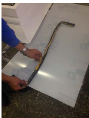
obr. č. 4