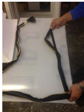
obr. č. 3