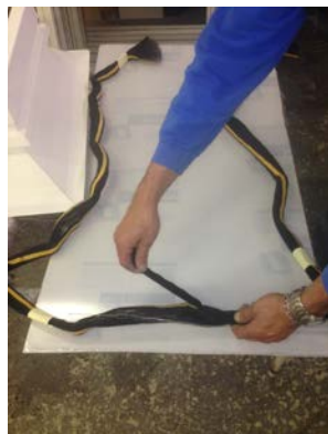
obr. č. 2