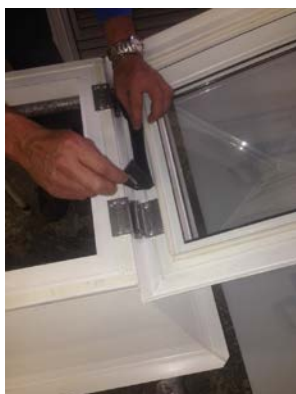
obr. č. 5